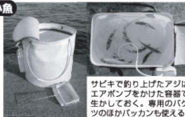
サビキで釣り上げたアジはエアポンプをかけた容器で生かしておく。専用のバケツのほかバケツでも使える

エサに使用するのは生きた小魚。代表的なのは10~15cmの小アジやカタクチイワシだが、小サバ、イサギの子なども使えるが食いは落ちる。とにかく生きの良さが大事なので、まめな海水の入れ替え、エアのチェックを怠らないこと。