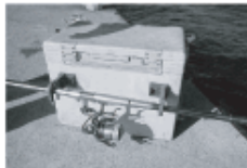
クーラーに取り付けた竿受けがあればエサ交換時に重宝する

ロッドは穂先が柔軟な磯竿が最適だ。ツバスがメインなら1.5号ぐらいでもいいが、ハマチ・メジロクラスだと2~3号はほしい。ラインは3~4号、ハリスもそれに合わせる。ハリスは伊勢尼やチヌバリなど丈夫なものを、エサのアジをセットしたら山なりにソフトに投入。海面に叩きつけるとアジが弱るので注意。ポイントは潮通しがよい波止の先端部や沖向きなど。