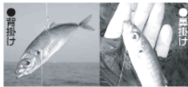
小アジなら背掛けが鼻掛けにするのがポピュラーだ

背ビレの少し前に刺す背掛けはエサのアジを深く潜らせたいときの泳ぎ優先の刺し方。鼻掛けはエサのアジに負担が少なく回収時の抵抗も小さいのでアジを長持ちさせたいときの刺し方。