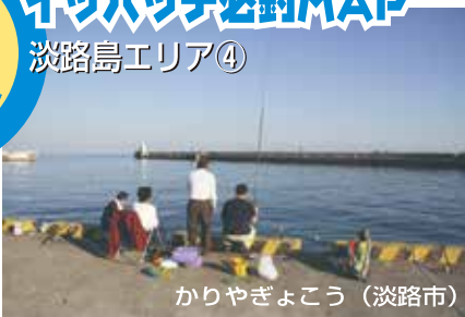
かりやぎょう (淡路市)