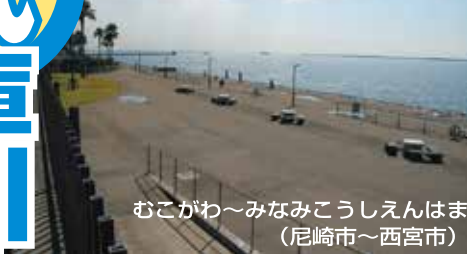
むこがわ～みなみこうしえんはま (尼崎市～西宮市)

■大阪の都心からアクセス最短、南甲子園浜、鳴尾浜、尼崎（武庫川河口左岸）は、ふたつの釣り公園と浜遊びやバーベキューも可能な海浜公園が並び、ファミリーで気軽にかけられるうれしいエリア。もちろん釣りの方も簡単なサビキ釣りから本格的なエビ撒き釣り、フカセ釣りまで楽しめるうえ、スズキやチヌも大物の実績も申し分ない。阪神高速の湾岸線を使えばアクセスは超簡単、阪神高速神戸線や名神高速の利用でも、インターから釣り場まで遠くない。