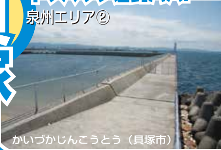
かいづかじんこうとう (貝塚市)

■島の北半分は工場も多く改正SOLAS条約の関係で立ち入りができず、物々しい雰囲気のところほとんどだが、南半分は二色の浜公園の一角、海浜緑地として整備され、海と親しむことができるようになっている。特にテラスと呼ばれる南西角のすぐの並びには無料駐車場もありありがたい。また食品コンビニートとの間にある二色の浜も秋から冬場の投げ釣りが面白い。北側の貝塚港は釣り客が意外と少ない穴場で車が横付けできるラクテンポイント。