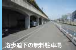
遊歩道下の無料駐車場

★貝塚港★人気釣りの貝塚人工島が近くにあり、湾奥に位置しているため比較的人が少ない釣り場だがエビ撒き釣りや落とし込み釣りで人気がある。車横付け可。もちろんサビキ釣りもOK。タコジグで際を探ってマダコもいける